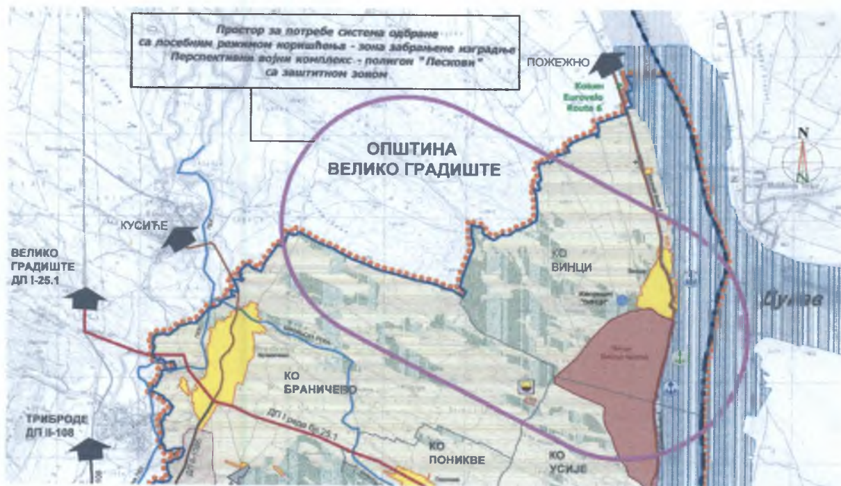
Слика бр. 1.

Обавештавамо Вас да је наведени услов изузетно рестриктиван и ограничавајући за будући развој општине Голубац и није у сагласности ни са постојећом наменом површина.